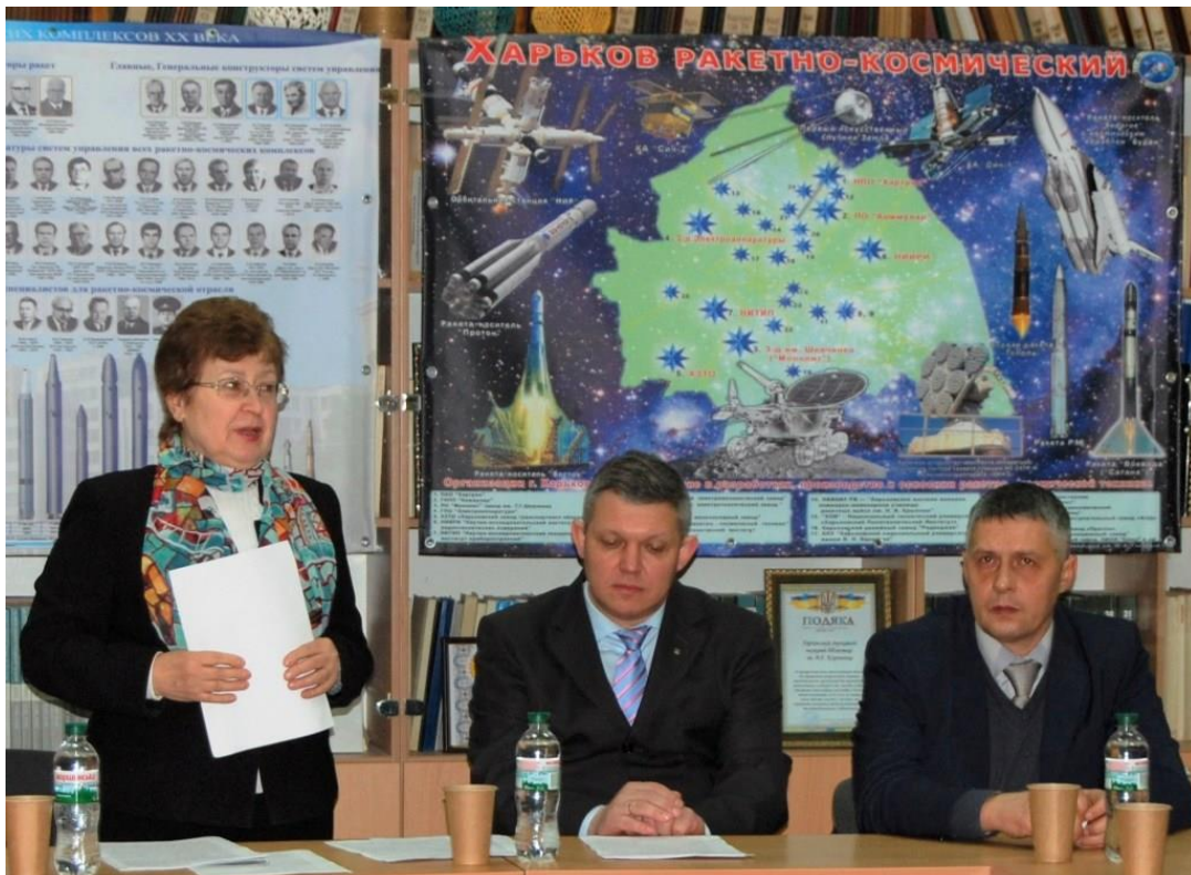
Виступ на розширеному засіданні колегії Центрального державного науково-технічного архіву України з нагоди 50-річчя від дня його заснування. м. Харків, грудень 2019 р.